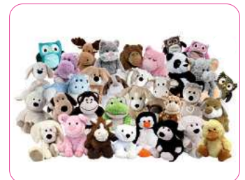
Warmies ab 23,90 €