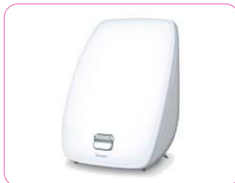
Beurer Tageslichtlampe ab 89,99 €