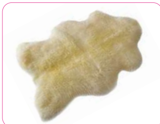
Russka Schaf-Fell ab 109,-€