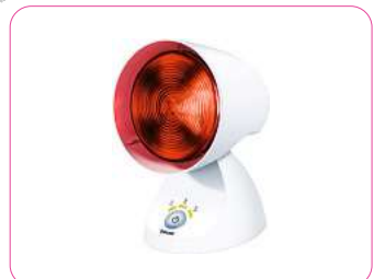
Beurer Infrarotlampen ab 26,99 €