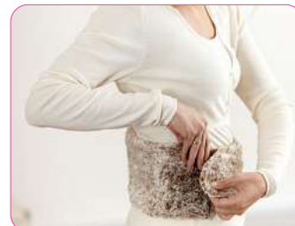
Warmies Wärmegürtel ab 24,99€